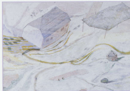
z.t. 2004, tempera, pastel en potlood op papier 30 x 40 cm, Collectie AEGON

realistische associatie op te roepen, maar ook 'vervormd' genoeg om er nieuwe werelden van te maken. Zo zwerft Kruisbrink in haar werk heen en weer tussen de beeldtaal van realistische luchtfoto's en romantische vergezichten. Voor de toeschouwer is het een ideaal gebied om in te dwalen en te verdwalen." <<