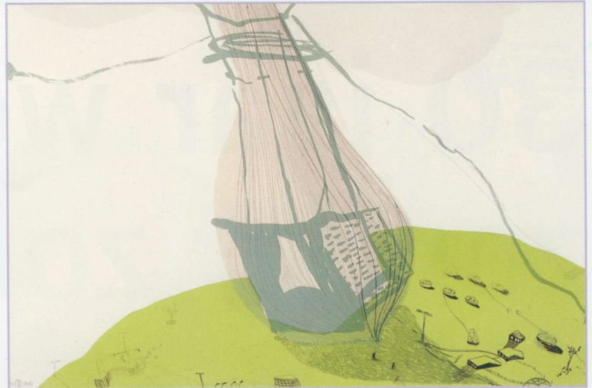
z.t. 2001 litho, 36 x 53 cm Collectie AEGON

In 'Kunstbeeld 4' van maart 2005 wordt haar werk kernachtig getypeerd: "De tekeningen van Sandra Kruisbrink zijn fragiel, lichtvoetig en associatief. Haar intuïtieve werkwijze wint het steeds van de rationele benadering, omdat zij zich gewillig laat meeslepen door waarnemingen en de gedachten die daaruit voortvloeien. Zo ontstaan onwerkelijke landschappen - altijd in vogelperspectief - die vertrouwd genoeg zijn om een